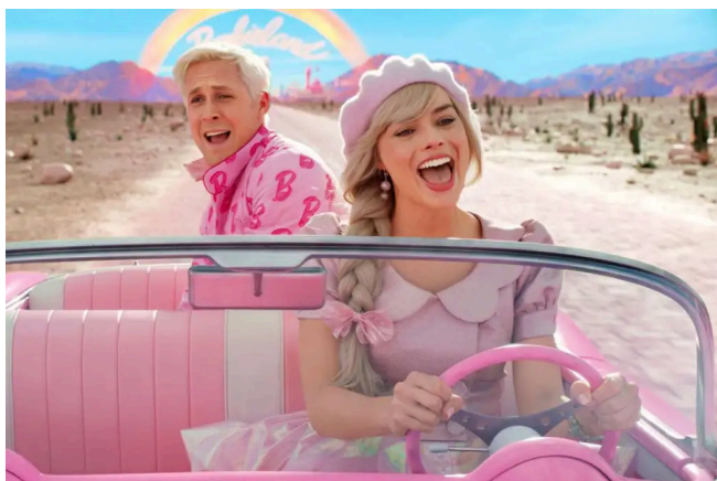
Margot Robbie și Ryan Gosling în Barbie, regia Greta Gerwig