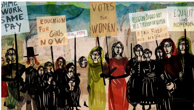
Visul sultanei (r. Isabel Herguera)

povestea unui băiat naufragiat pe o insulă îndepărtată, unde va învăța lecții vitale despre ordinea naturală a lucrurilor și valorile cele mai importante ale vieții.