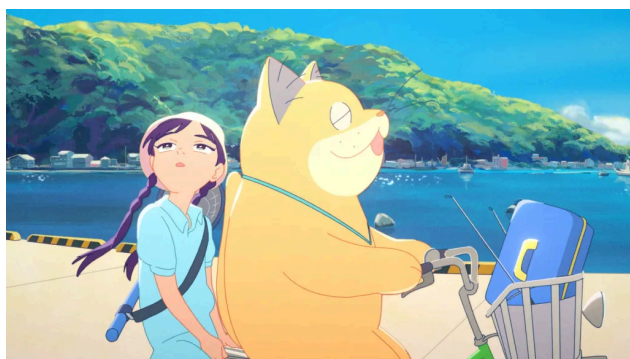
Anzu, pisica-fantomă (r. Yoko Kuno, Nobuhiro Yamashita)