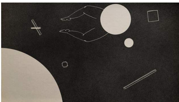
A Body, regia Milena Tipaldo