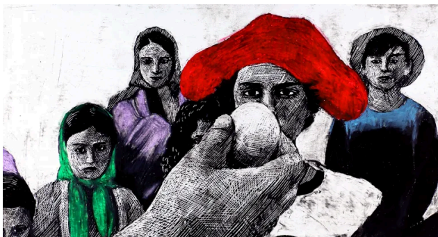
Nowhere, regia. Simone Massi

Programul „Ciao, Italia!” – țară invitată la Animest 2024 este sprijinit de Institutul Italian de Cultură din București și de Animaphix – Festivalul Internațional de Film de Animație din Sicilia .