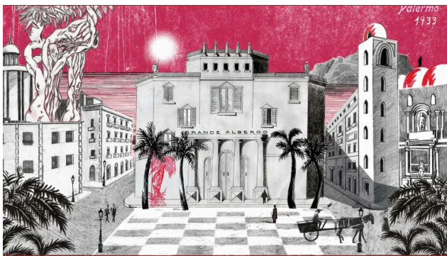
The Angst and the Bliss, regia Mangoosta