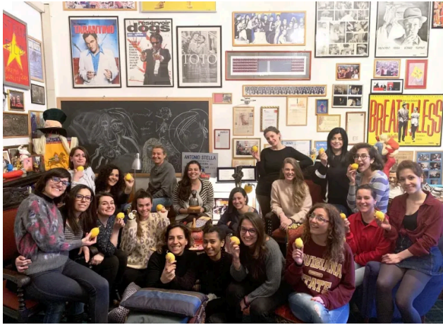
Echipa Mad Entertainment Studio