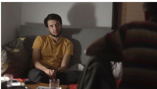
O familie aproape perfectă, regia Tudor Platon