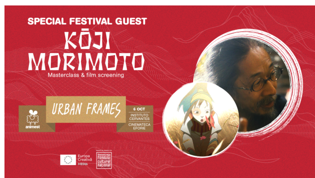
Kōji Morimoto – invitat special @Animest.19