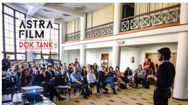
Astra Film DocTank