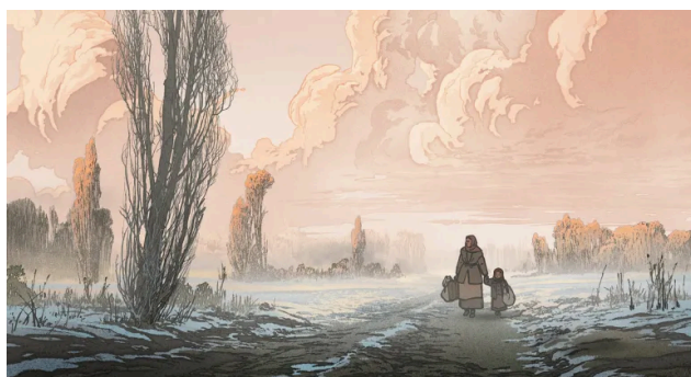
The Most Precious of the Cargoes, regia Michel Hazanavicius