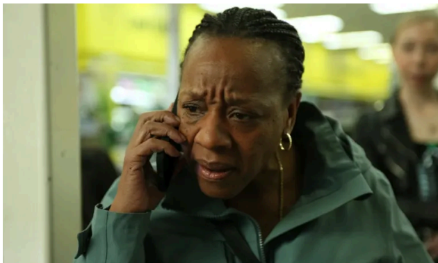
Marianne Jean-Baptiste în Hard Truths , regia Mike Leigh