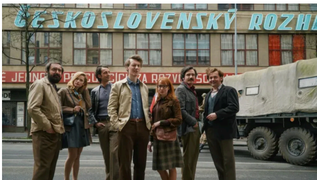
Waves , regia Jiří Mádľ

bunica ei, ale căror reacții evoluează de la șoc la apreciere pentru calitățile literare ale textului. Filmul este ultima parte a unei trilogii despre sentimentele și relațiile umane, după Sex (2024) –premiat de asemenea la Berlin – și Love (2024), care a avut premiera la Veneția și a fost premiat la Göteborg. Toate cele trei filme vor fi proiectate la TIFF.24.