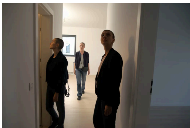
Interior zero, regia Eugen Jebeleanu