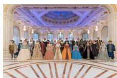
Corul Național de Cameră „Madrigal – Marin