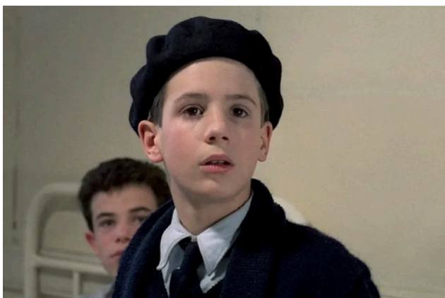
Au revoir les enfants

deja sold-out. Programul complet poate fi găsit pe site-ul