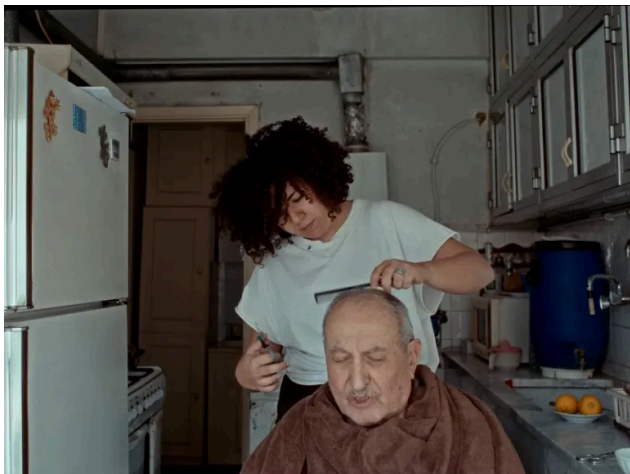
Suntem înăuntru, regia Farah Kassem