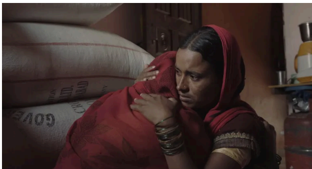
Înaintând prin întuneric, regia Kinshuk Surjan