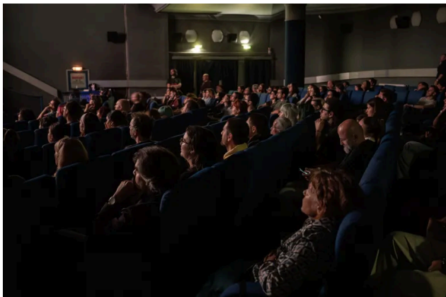
Publicul Animest la Cinemateca Eforie