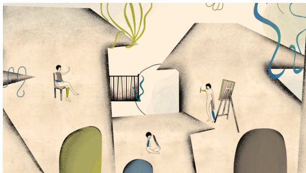
Fracti, regia Lavinia Petrache