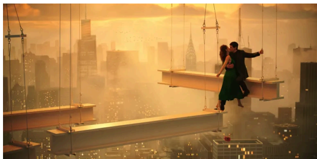
Megalopolis, regia Francis Ford Coppola