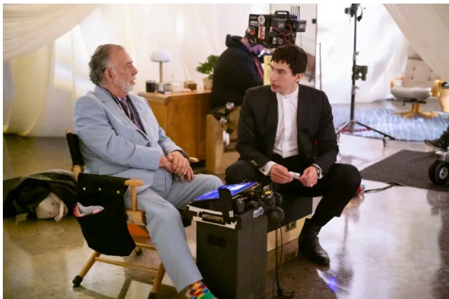
Francis Ford Coppola și Adam Driver pe platoul de filmare